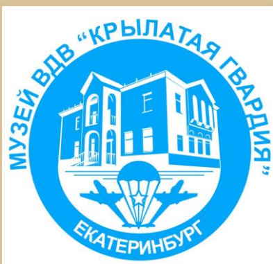
Музей «Крылатая гвардия»