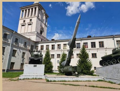
Музей «Боевая слава Урала»