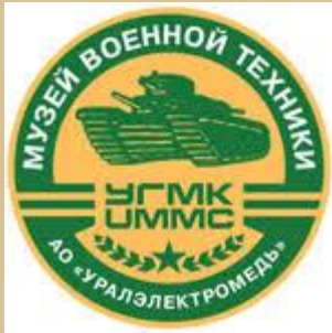
Музейный комплекс военной и гражданской техники (Верхняя Пышма)